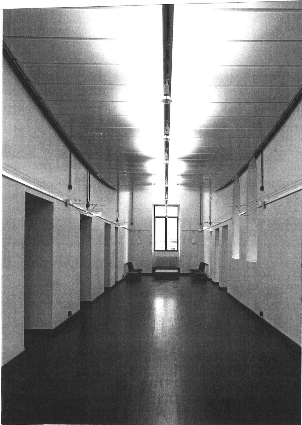
Couloir au 1 er étage