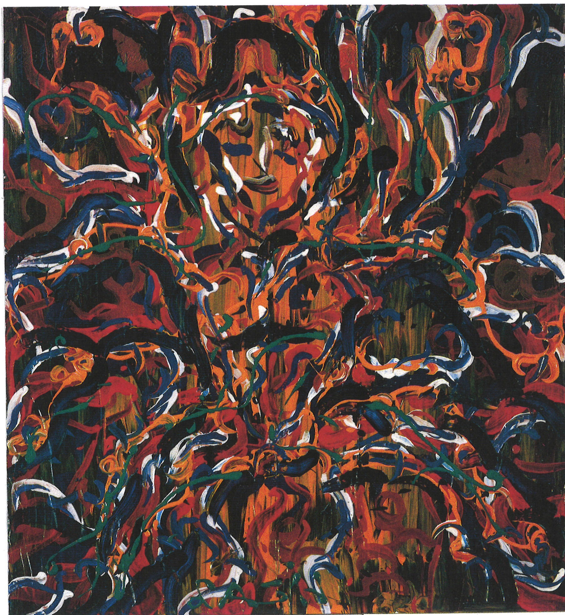
OLYMPIC, LASH 1994